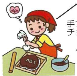
手づくり チョコ派にも♪

◇添加物の入っていないシンプルな原材料に注目！ カカオ本来の美味しさが引き立ちます。